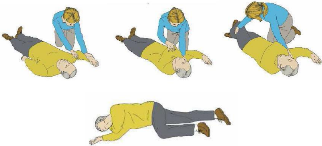
Figura 2: Pasos para colocar al accidentado en Posición Lateral de Seguridad (PLS).