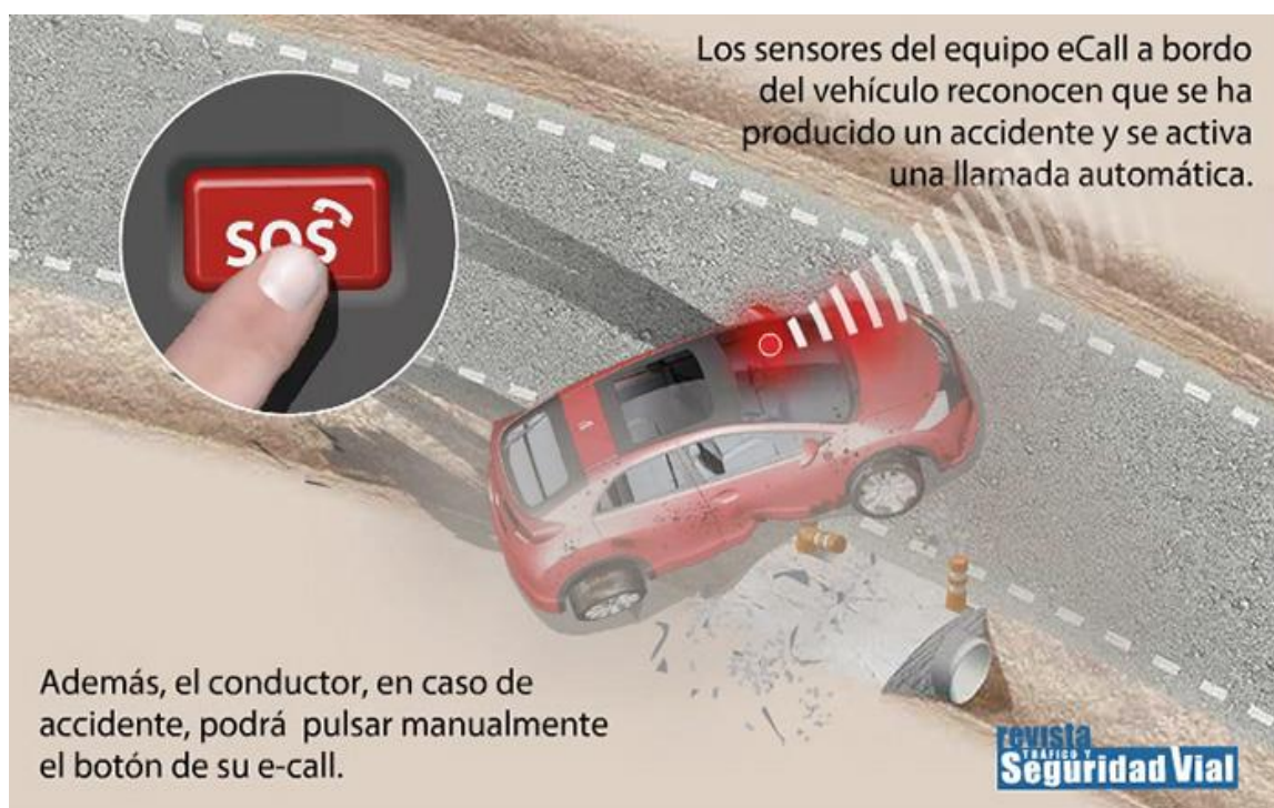
Figura 1: Publicación de la Revista DGT en julio 2018.

Para funcionar, el sistema eCall se sirve de una tarjeta SIM, sensores instalados en el vehículo y mecanismo de localización por satélite.