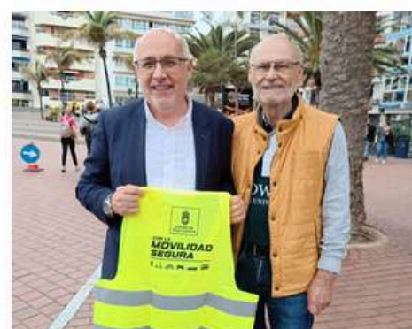
Presidente del Cabildo de Gran Canaria