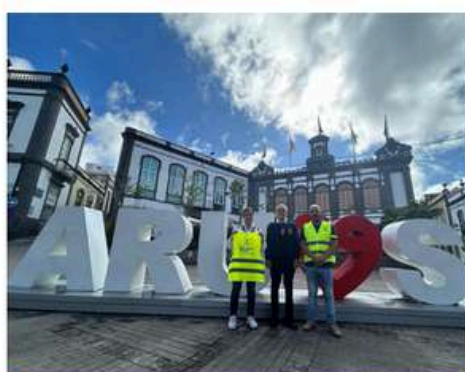
Ayuntamiento y policía local de Arucas