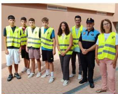
Ayuntamiento y policía local de Gáldar