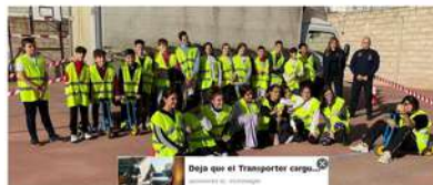
Escolares de Puente Genil participando en la formación sobre educación vial.