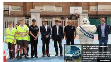
El programa VIA de formación vial para jóvenes llega a Valladolid de la mano de Michelin.

La primera fase del proyecto llegará a cerca de 300 estudiantes del Colegio La Salle