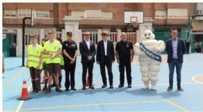
Responsables del Colegio y de las empresas patrocinadoras durante la presentación del programa

elEconomista.es Valladolid • 3/05/2023 • 6:27