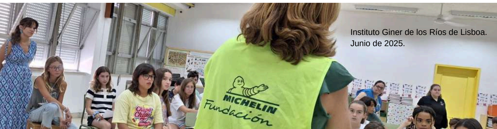
Instituto Giner de los Ríos de Lisboa. Junio de 2025.

De esta forma, se abre una nueva etapa que refuerza el compromiso de la Fundación Michelin España Portugal con la educación vial en Portugal y con la formación de una generación más consciente y segura.