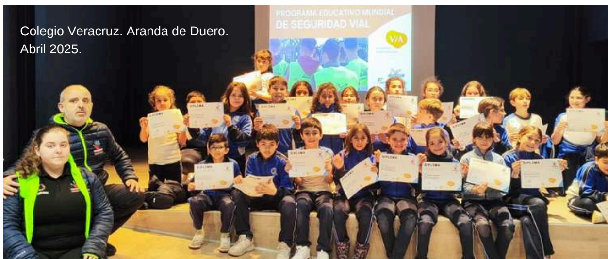
Colegio Veracruz. Aranda de Duero. Abril 2025.

Cada centro educativo que recibe las actividades del programa VIA emite un certificado de impartición, haciendo constar la fecha de inicio y el número de beneficiarios del programa.