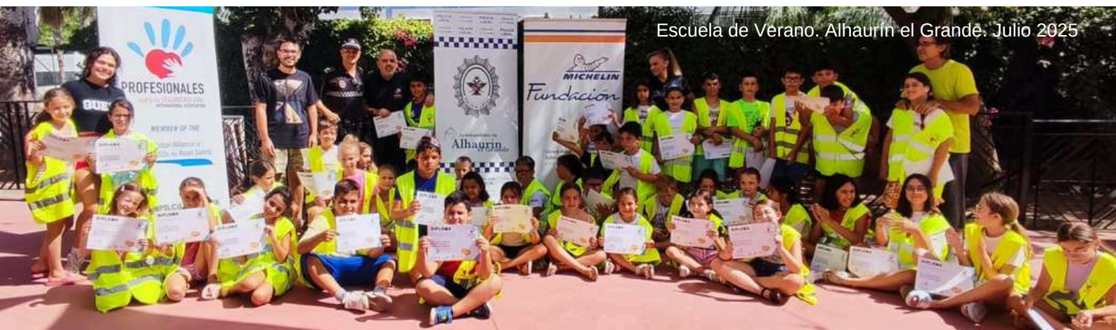
Escuela de Verano. Alhaurín el Grande. Julio 2025