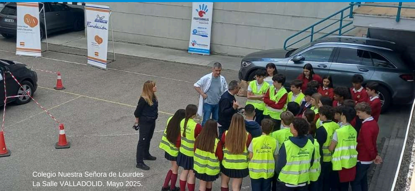
Colegio Nuestra Señora de Lourdes La Salle VALLADOLID. Mayo 2025.

Tras superar las dificultades iniciales, las actividades del Programa VIA llegaron a Almería en noviembre de 2024, y en 2025 han sido más de 600 escolares de cinco colegios de la provincia quienes han disfrutado de ellas.