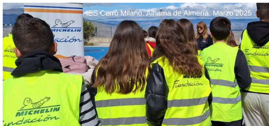
IES Cerro Milano. Alhama de Almería. Marzo 2025

Más de 600 escolares reciben las clases del Programa VIA en la provincia de Almería en 2025.