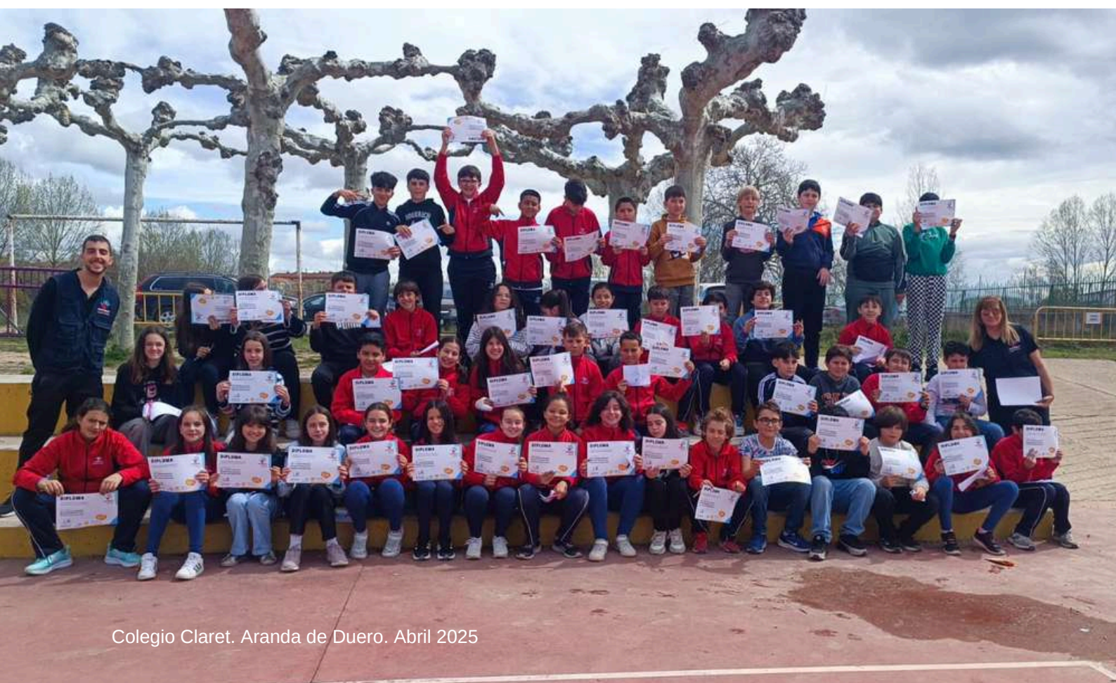
Colegio Claret. Aranda de Duero. Abril 2025

Desde el año 2022, cuando comenzó la alianza entre la Fundación Michelin España Portugal y AIPSEV, colegios de las ciudades de Valladolid y Aranda de Duero han participado cada año en las actividades del Programa VIA, destacando la buena disposición de los centros educativos y la colaboración de la Policía Local de ambas ciudades.